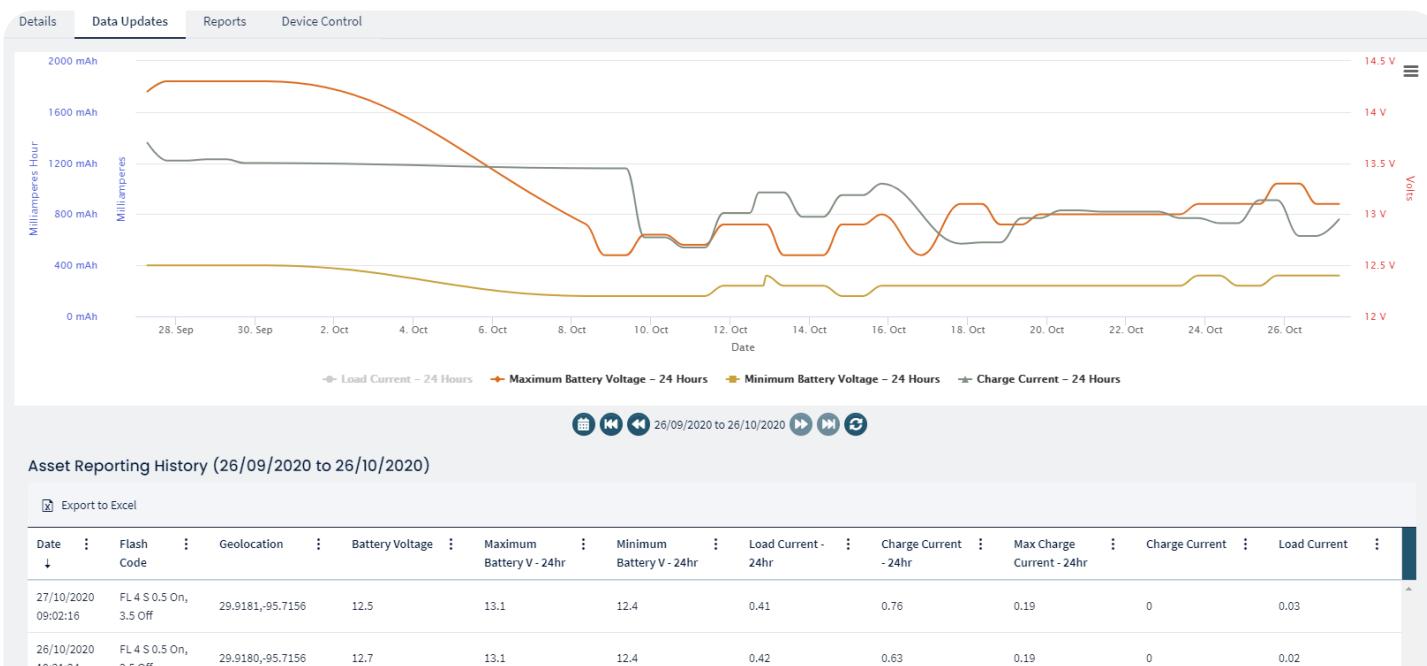
Site da Star2M mostrando o status da lanterna ou da bateria de "ativos", localização e códigos flash.

O serviço de hospedagem e comunicações seguras da Star2M ajudou a PACI a avaliar e manter proativamente o status operacional de todos os AtoNs habilitados.